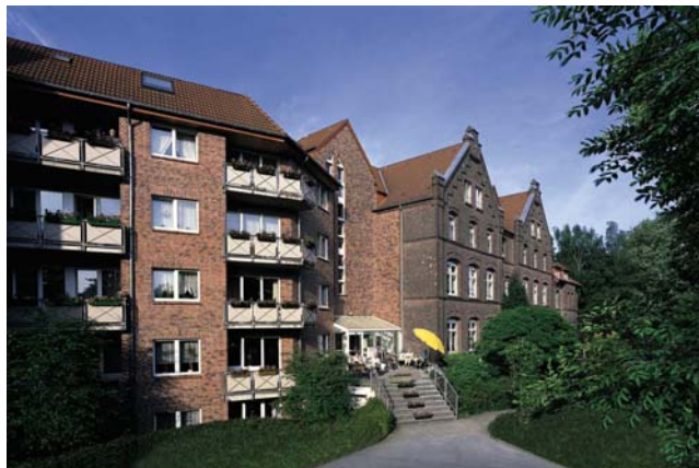
LUDGERI-Seniorenwohnungen, Ermelinghofstr. 16