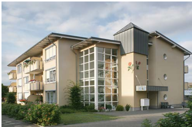
Das Rosenhaus in Hövel an der Friedrich-Ebert-Str. 62

Der Ortskern von Hövel ist über fußläufige Wege durch schön angelegte Parks in kurzer Zeit zu erreichen und bietet immer wieder ein lohnendes Ziel für einen kleinen Spaziergang.